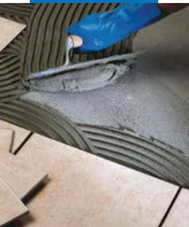
Укладка плитки ординарного обжига на пол